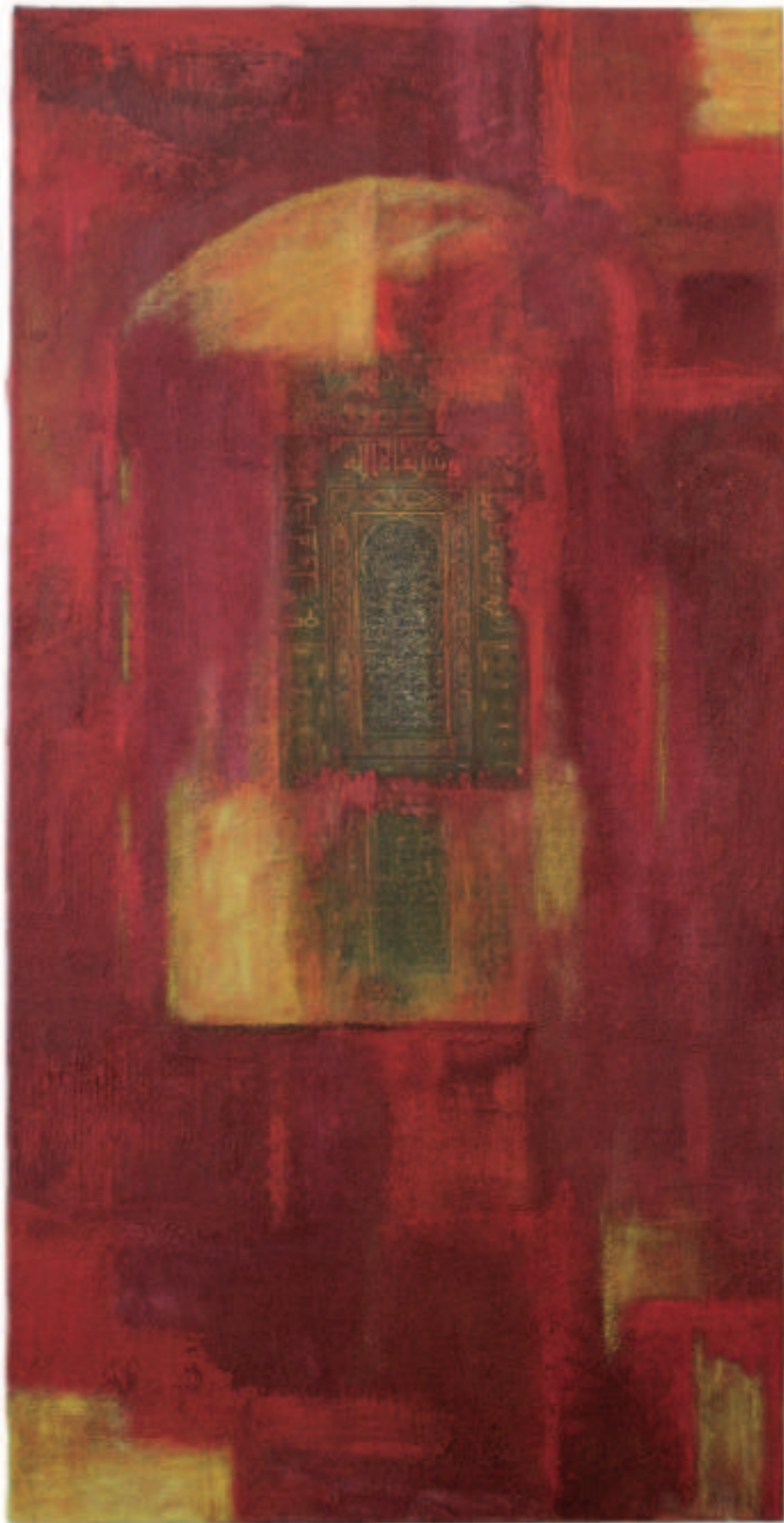
Tor zum Süden, Mischt./Collage a. Lwd., 120/60 cm, 2010