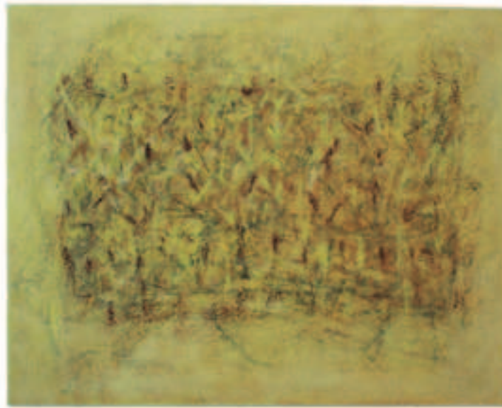
Gelb außer Rand u. Band, Mischt./Öl a. Lwd., 69/87 cm, 2011