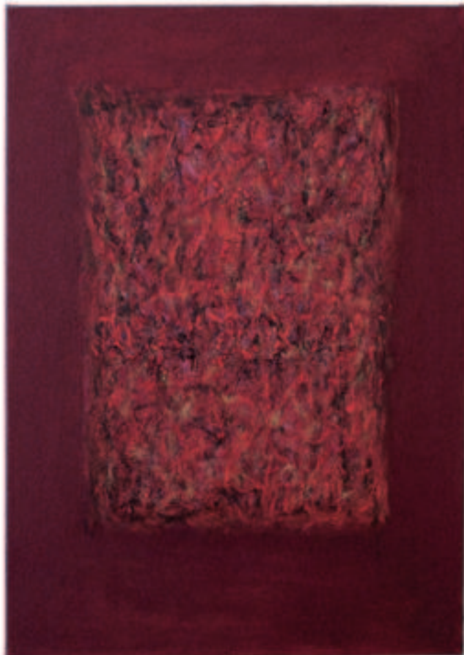
Prometheus – befreit, Mischt./Öl a. Lwd, 85/60 cm 2011