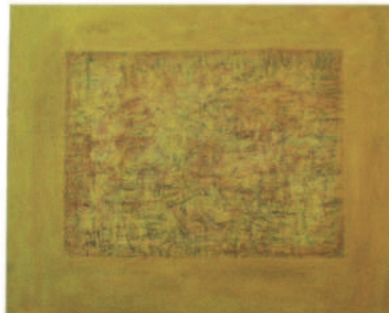
Gelb – gebändigt, Mischt./Öl a. Lwd., 80/100 cm, 2011