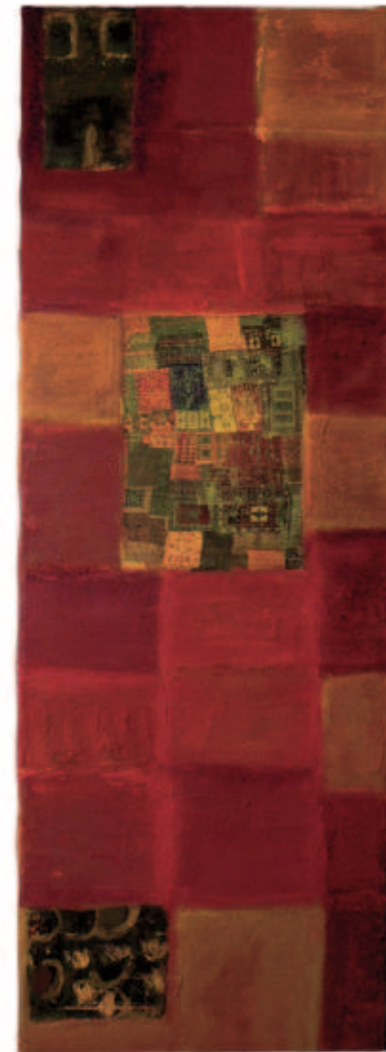
Im Teppichbazar, Mischt./Collage a. Lwd., 120/40cm, 2010