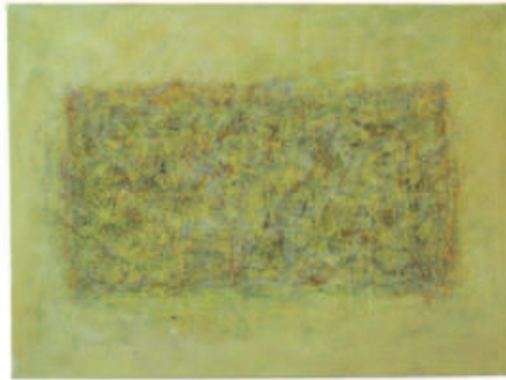
Gelb in Frühlingslaune, Mischt./Öl a. Lwd., 65/88 cm, 2011