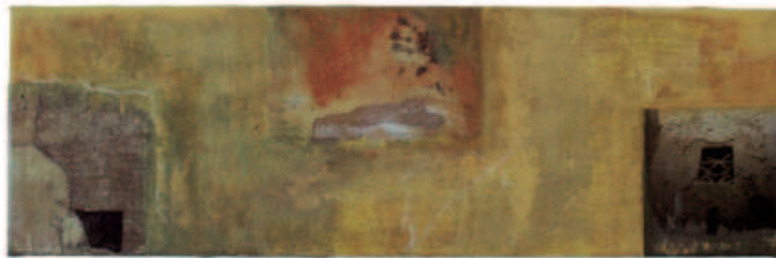
Sahara-Sehnsucht, Mischtechnik/Collage auf Leinwand, 30/95 cm, 2011