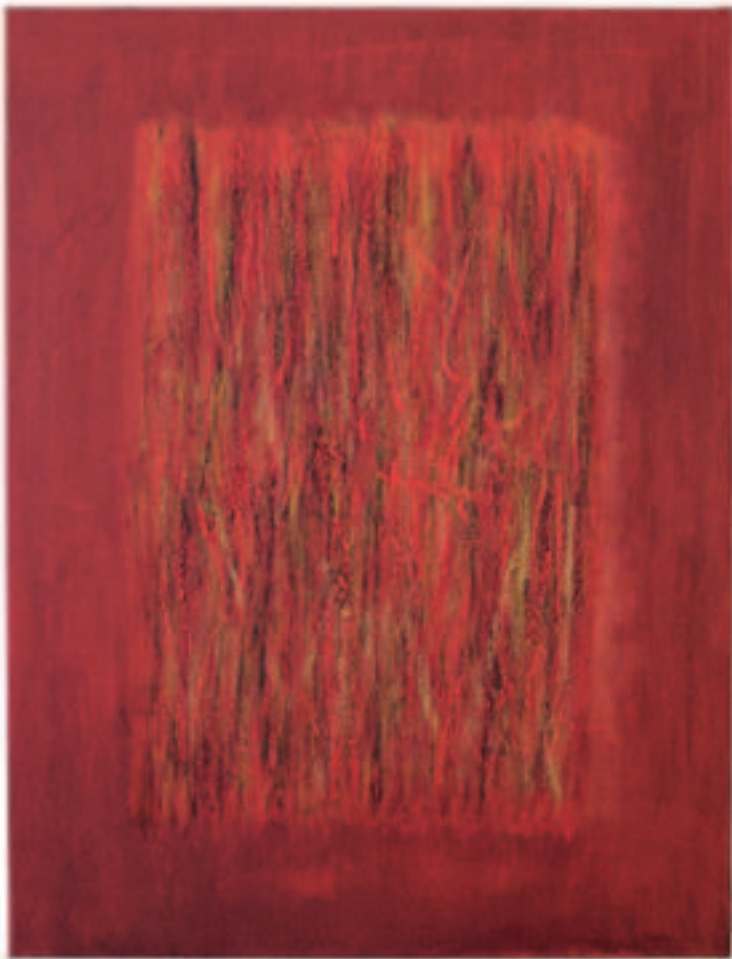
Freudenfeuer, Mischt./Öl a. Lwd., 85/65 cm, 2011