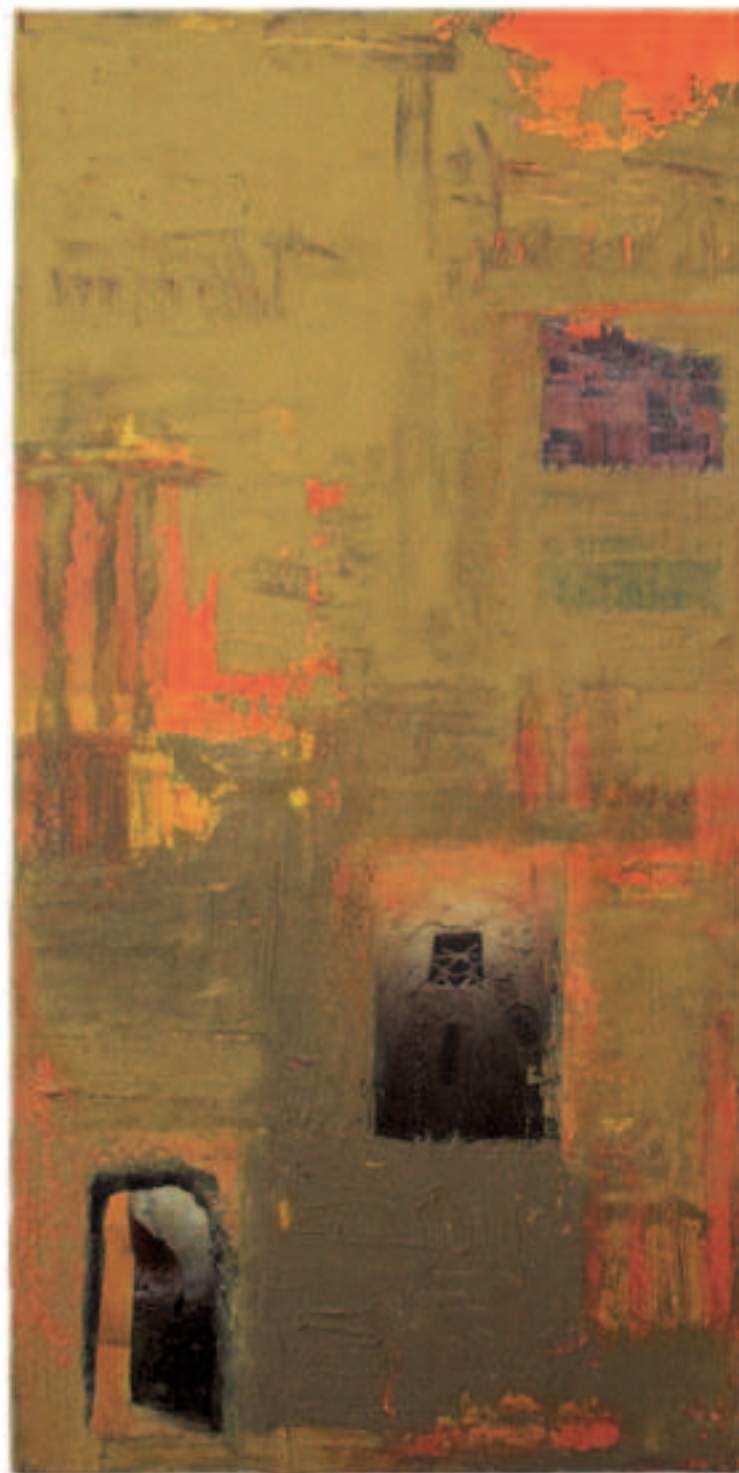
Wüstenwanderung, Mischt.a.Lwd., 120/60 cm, 2010